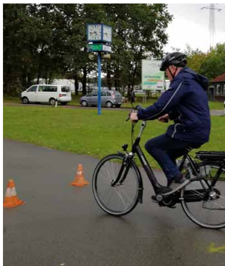
Training auf dem Verkehrsübungsplatz in Lingen

scheidend ist, dass der Helm die Stirn, die Schläfe und den Hinterkopf ausreichend schützt. Er sollte sich möglichst individuell einstellen lassen.