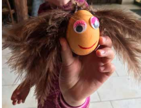
Osterei – mal etwas anders

Auf dem Bauernhof Wigger in Greven kann man viel entdecken. Ein Team von KAB-Mitgliedern wird gemeinsam mit Kindern und Eltern die Tage gestalten. Es wird zusammen gekocht, Brettspiele wer-