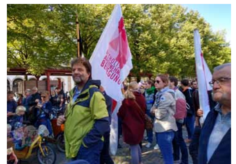
KAB zeigt Flagge bei Klima-Demo.

wege. Das Stadtoberhaupt erklärte, einige der Forderungen müssten vor der Umsetzung einer genauen Prüfung unterzogen werden. Andere umweltschonende Maßnahmen seien in Osnabrück bereits auf den Weg gebracht worden.