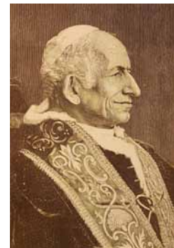
Papst Leo XIII.

Die KAB fühlt sich in besonderer Weise als Träger der Soziallehre immer verpflichtet, für deren Grundsätze einzutreten. Vielfach sind die klassischen Dokumente der Katholischen Soziallehre nicht mehr bekannt; wie die Enzykliken „Rerum novarum“ von Papst Leo XIII. oder „Quadragesimo anno“ von Papst Pius XI., um nur einige zu nennen. Auch heute erfahren Schüler an Gymnasien und Berufsschulen im Sozialkundeunterricht kaum etwas zur Soziallehre. Dabei verlangen heute Gewerkschaften und Politik immer häufiger nach diesen