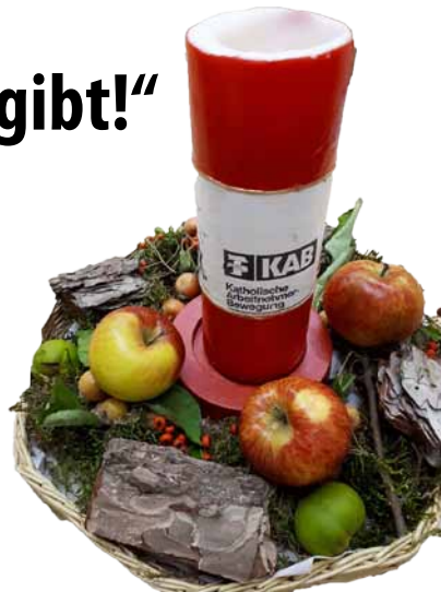
Tischschmuck beim Jubiläumsnachmittag

Am 13. September 1959, also vor über 60 Jahren, trafen sich 66 Personen nach dem Hochamt in der Grundschule in Darne zur Gründungsveranstaltung der Katholischen Arbeitnehmer-Bewegung Christ König Darne. Im feierlichen Rahmen wurde vor einigen Wochen der 60. Gründungstag begangen. Jedes Mitglied hatte eine persönliche Einladung erhalten, dreißig von ihnen trafen sich dann im Pfarrheim bei Kaffee und Kuchen zur Feier des Jubiläumsgedenkens und um die vergangenen sechzig Jahre in lebhaften Gesprächen noch einmal Revue passieren zu lassen und an wichtige Ereignisse im Vereinsleben zu erinnern. Dabei wurden die Spuren der KAB in der Gemeinde – das, was von Männern und Frauen der KAB angeregt oder verwirklicht worden war – noch einmal sichtbar. Fotos erinnerten an Fahrten, Ereignisse, frohe und ernste Begebenheiten und boten Gelegenheit zu intensivem Austausch. Selbstverständlich waren dabei „auch die verstorbenen KAB-Mitglieder mit im Gespräch“. Die anschließende Sonntagvorabendmes-