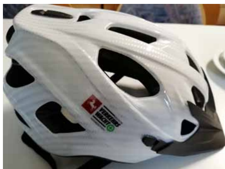
So sollte ein guter Fahrradhelm aussehen.

Die gängigen Pedelecs sind spezielle Fahrräder mit elektronischer Fahrunterstützung, bei denen der Motor erst anspringt,