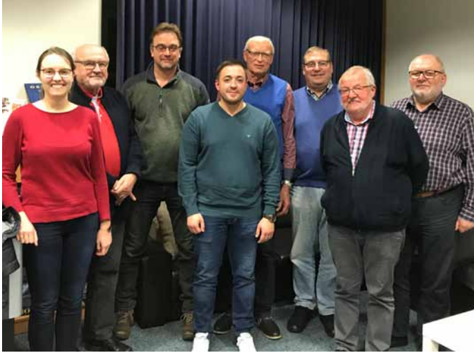
Gedankenaustausch zwischen KAB und SPD Osnabrück